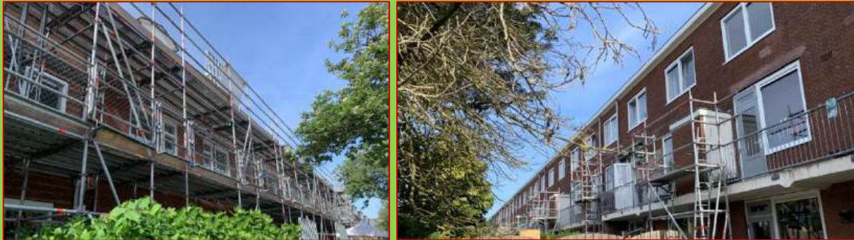
Verduurzamingsproject 40 woningen Muiderslotweg, links de voorkant, rechts de achterkant.

Op een mooie ochtend in mei 2025 vertelt Mirella van Ymere over dit project.