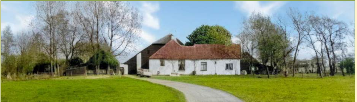
De boerderij in de jaren '60.

Voor de zomervakantie verschijnt mijn boek Denkend aan Noord-Akendam . Mijn belangstelling voor deze vervallen historische boerderij begon in december 2020. Als nieuwe voorzitter van wijkraad Vondelkwartier raakte ik betrokken bij de discussie over een geschikte locatie voor de Skaeve Huse. Denkend aan Noord-Akendam heb ik geschreven als 'living history'. Het is mijn persoonlijke terugblik op de afgelopen vijf jaar waarin ik mij, aanvankelijk namens de wijkraad Vondelkwartier en nu het wijkplatform Leefbaar Vondelkwartier, heb ingespannen om de boerderij op te knappen tot een ontmoetingscentrum voor oudere inwoners in onze wijk. Dat deed ik uiteraard niet alleen, maar met de onmisbare steun van actieve ondernemers en (wijk)organisaties, sinds 2025 verenigd in de Stichting Weij-land. In de Vondel van juni lees je meer informatie over de prijs en waar je het boek kan kopen.